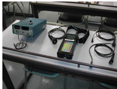
超音波肉厚測定調査